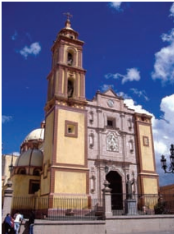
SAN AGUSTÍN, TLAXCO